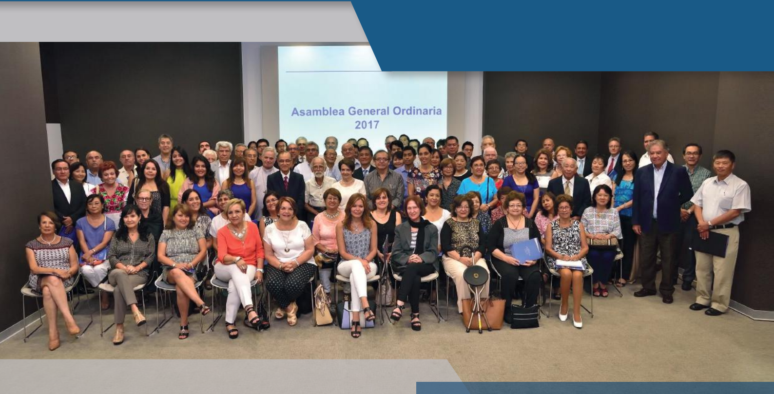
Socios asistentes a la Asamblea General 2017